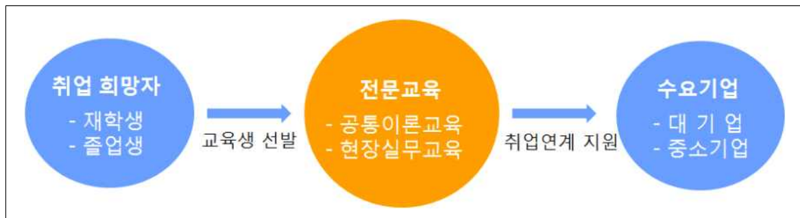
<바이오인력양성 프로그램 구조>